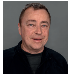
Tax Manfred Jhg. 1969 Untermarias 200a, Dalaas Techniker