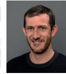
Burger Florian Jhg. 1986 Poller 39b, Dalaas Monteur